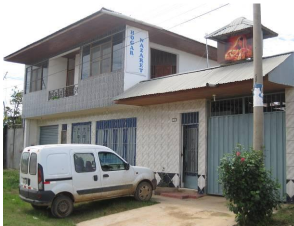
Imagen del exterior del “Hogar de Nazareth” en el que, hasta que construyamos uno mejor, los niños encuentran el significado de la palabra “esperanza”.

Además de a la familia que es nuestro Hogar, los niños se incorporan a la familia cristiana por el Bautismo.